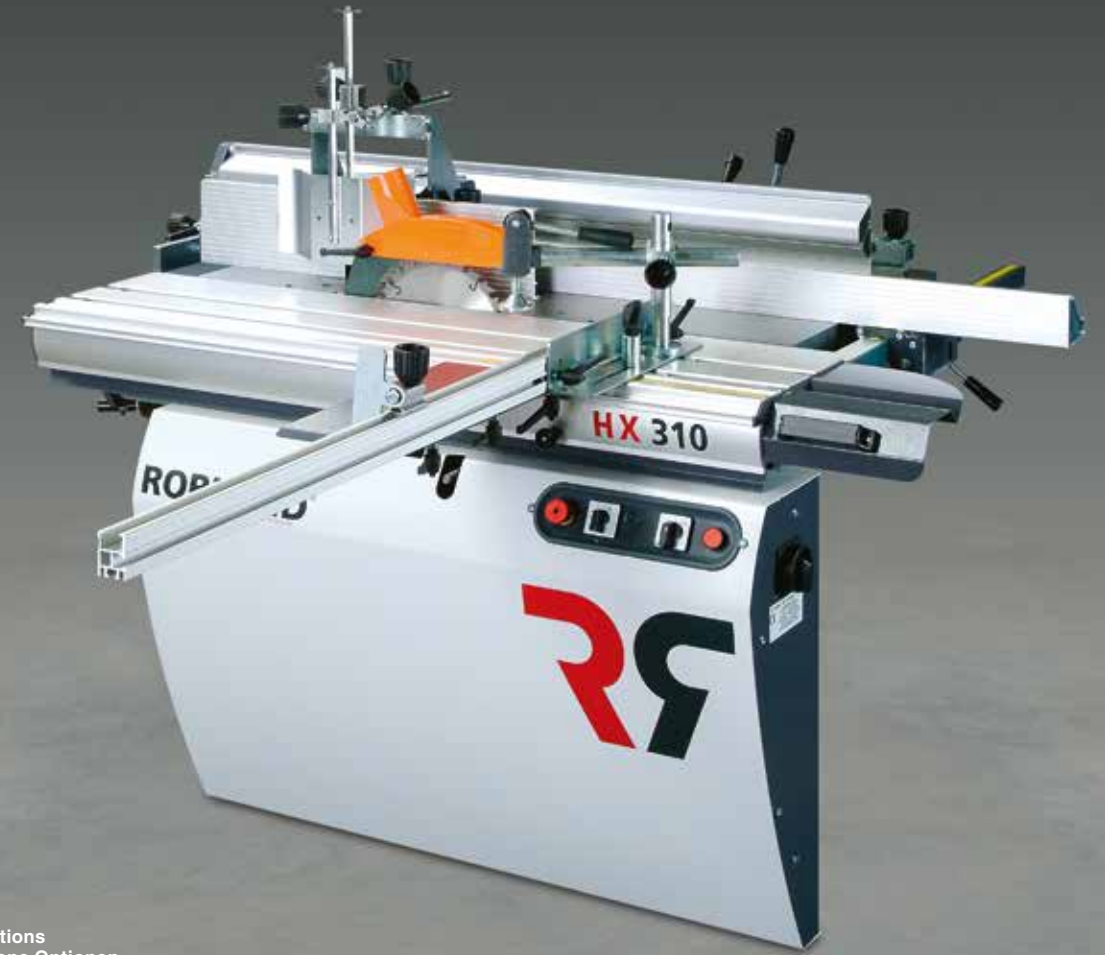
Machine met opties Machine avec options Machine with several options Maschine mit verschiedene Optionen

OPTION The 3-knives Tersa cutter block offers you all the confort and precision when changing the knives. OPTION Mit der Tersa Dreimesser Hobelwelle mit Schnellspannung sparen Sie Zeit beim Messereinstellen.