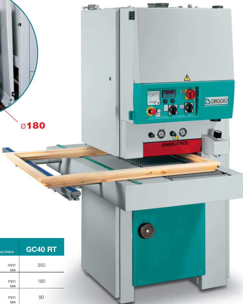
GC 40 RT

RT - Комбинированный узел с калибровальным валом и жестким утюжком для заготовок из массивной древесины